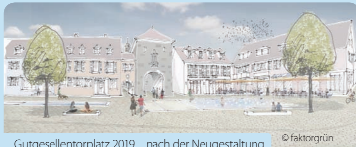
Gutgesellentorplatz 2019 – nach der Neugestaltung