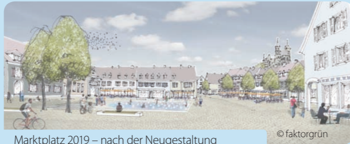
Marktplatz 2019 – nach der Neugestaltung

Von Oktober 2017 – Oktober 2019 wird die Breisacher Innenstadt zur Baustelle – Breisach wird schöner!